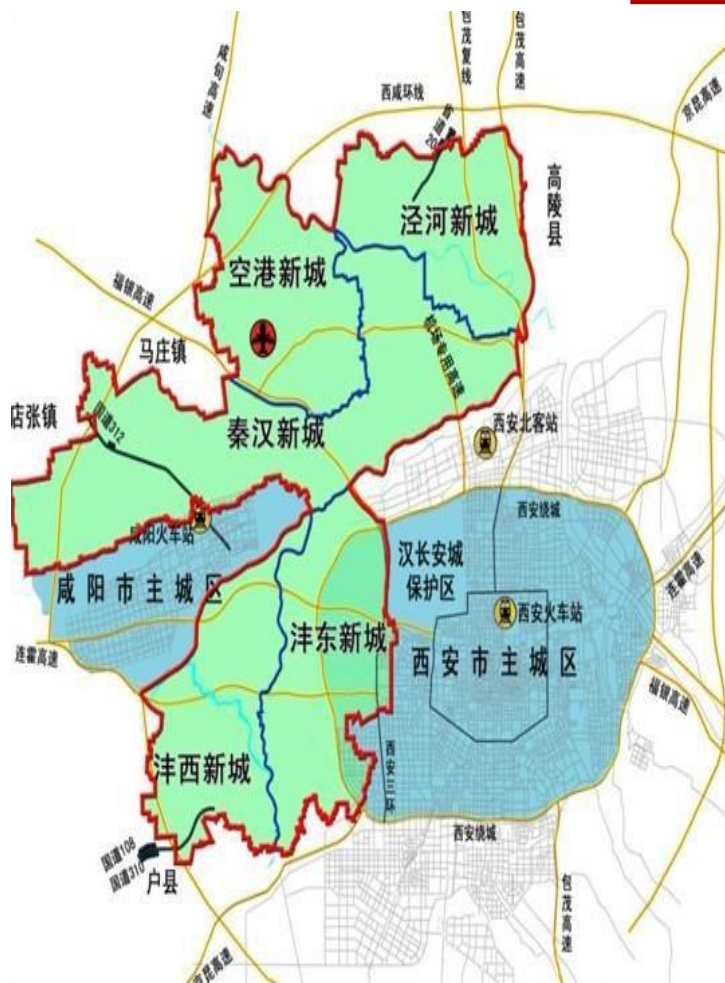
陕西省西咸新区区位图

2011年6月10日，经陕西省政府批准，设立西咸新区。2014年1月6日，经国务院批准，西咸新区升级为第七个国家级新区。